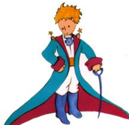
Aquí tienen el mejor retrato que más tarde logré hacer de él

Me puse en pie de un salto como herido por el rayo. Me froté los ojos. Miré a mi alrededor. Vi a un extraordinario muchachito que me miraba gravemente. Ahí tienen el mejor retrato que más tarde logré hacer de él, aunque mi dibujo, ciertamente es menos encantador que el modelo. Pero no es mía la culpa. Las personas mayores me desanimaron de mi carrera de pintor a la edad de seis años y no había aprendido a dibujar otra cosa que boas cerradas y boas abiertas.